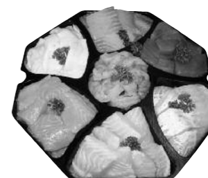
Gourmetschotel (vanaf 4 personen) www.wal-vis.nl