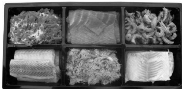
Wal-Vis Luxe borrelhap (voor 4 pers.) 14,95 www.wal-vis.nl

Naam: ..... Straat: ..... Plaats: ..... Telefoon: ..... Tijd: ..... E-mail: ..... Uiterste inleverdatum: vrijdag 23 december 2011 vrijdag 30 december 2011 tot 10.00 uur. Of anders even mailen: info@wal-vis.nl Bellen kan ook: 06-53807399