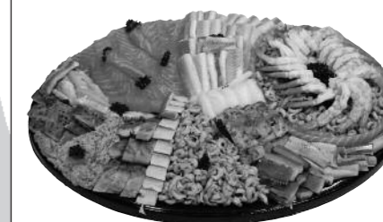
Visschotel Wal-Vis (vanaf 4 personen) www.wal-vis.nl